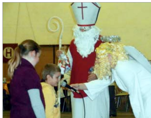
Mikulášská nadílka v sokolovně v Zeměchách