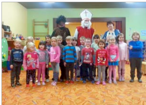
Vyfotili jsme se s čertem a Mikulášem