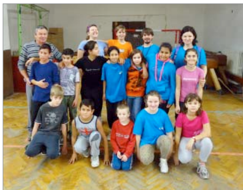
V Žatci jsme hráli vybíjenou